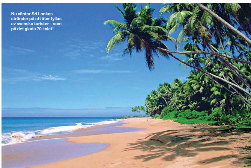
Nu väntar Sri Lankas stränder på att åter fyllas av svenska turister – som på det glada 70-talet!